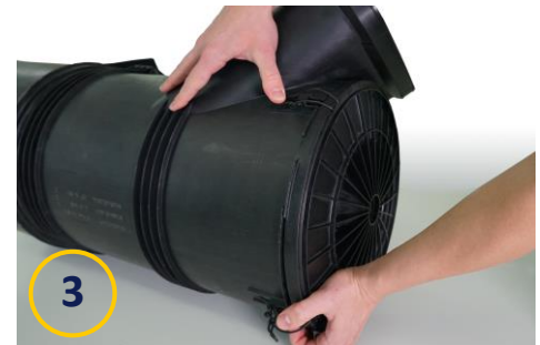
E1572L von Hengst mit MAN-Luftfiltergehäuse